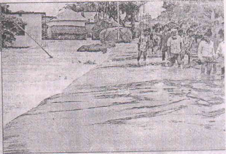
किशनगंज में सड़क के ऊपर तीन-चार फीट पानी आ जाने से आवागमन ठप .

खाल निशान घूमने को खेताब हुई नदियां : पृष्ठ 16